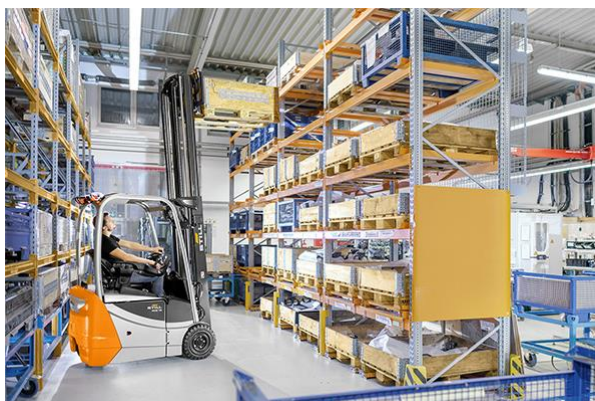
Imagem 6: O RXE 10-16C encaixa. Mesmo quando as coisas se tornam dinâmicas. Este veículo compacto está equipado de série com o comprovado Curve Speed Control. Isto mantém-no sempre em segurança - mesmo em curvas que são um pouco mais apertadas.