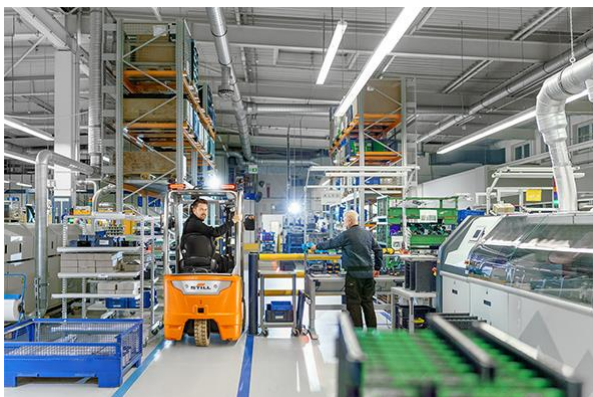
Imagem 2: Não existe tal coisa como "não vai caber". Com uma altura de pouco menos de 2 metros e uma largura de 1 metro, pode não caber em todos os bolsos, mas certamente cabe através de todas as portas. Isso torna-o particularmente valioso onde o espaço é escasso.