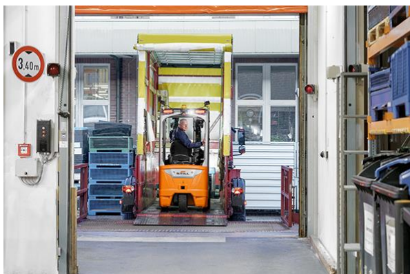
Imagem 3: Grande no mais pequeno dos espaços. Seja em empilhadores, contentores ou corredores estreitos, o RXE 10-16C é imbativelmente eficiente e ágil no mais pequeno dos espaços, graças às suas dimensões compactas e direção sensível.

A STILL recebe o RXE 10-16C - Novo membro da sua família e-truck Grande no menor dos espaços