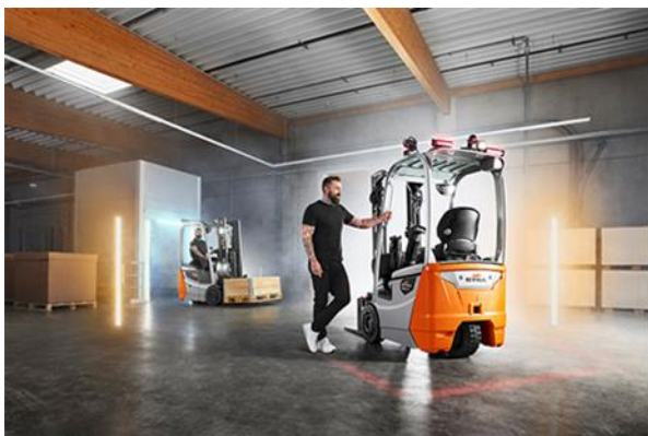
Imagem 1: Pode virá-lo da forma que quiser: o RXE 10-16C simplesmente encaixa. Sempre.